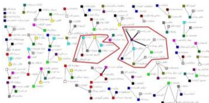
شکل ۱- شبکه هم‌نویسندگی

د. شبکه هم‌نویسندگی: شکل ۱، شبکه هم‌نویسندگی را نشان می‌دهد که شامل ۴۹ مؤلفه می‌باشد، بزرگ‌ترین شبکه هم‌نویسندگی ۱۰ گره‌ای است. در این شکل دو شبکه علامت‌گذاری شده است. خطوط ضخیم‌تر بین نویسندگان نشان‌دهنده تعدد همکاری می‌باشد. بزرگ‌ترین شبکه هم‌نویسندگی شامل ۱۰ نویسنده است. اعضای این شبکه از یونس بادآور نهندی، وحید